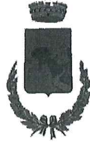
COMUNE DI SANT'ALESSIO IN ASPROMONTE