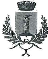
COMUNE DI CALANNA