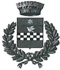
COMUNE DI LAGANADI