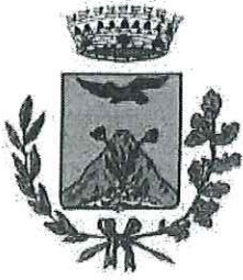
COMUNE DI CARDETO